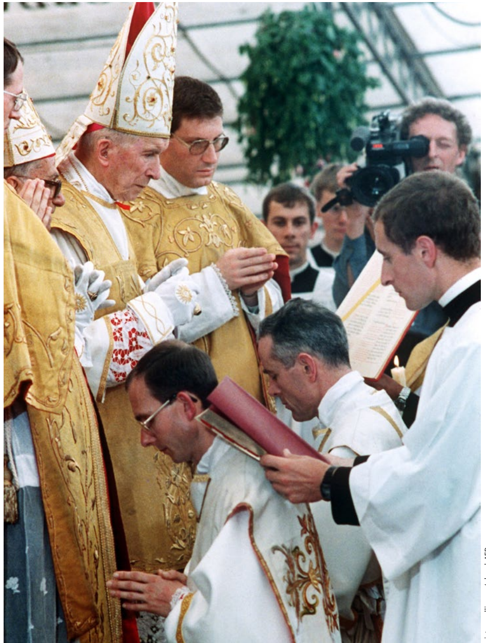
⚠ Der französische Erzbischof Marcel Lefebvre weihte am 30. Juni 1988 ohne päpstliche Zustimmung in Écône vier Priester zu Bischöfen und exkommunizierte damit nach katholischem Kirchenrecht sich selbst und die Geweihten. Lefebvre, der 1991 starb, hatte Anfang der 1970er-Jahre die Priesterbruderschaft des Heiligen Pius X. gegründet. Hauptanliegen der Bruderschaft und ihrer Seminaritätigkeit ist bis heute die Bewahrung der alten „geheiligten“ Messordnung nach dem tridentinischen Ritus, deren Wesen Lefebvre durch die Liturgieform des Konzils in glaubenszerstörerischer Weise verfälscht sah.

Paulus hat sein Evangelium Petrus vorgelegt. Er war 14 Tage bei ihm und ließ sich explizit durch Petrus (Jakobus und Johannes) bestätigen und senden, um sicher zu sein, dass er mit seinem Evangelium an die